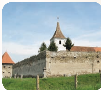
Nagyajta, unitárius templom