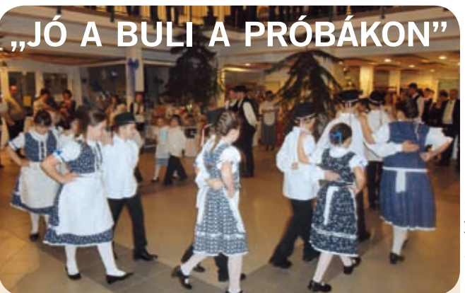
Fotó: Gogolák Mariann