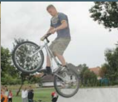
Ismét nagy sikere volt a Funboxnak

Szeptember 18-án, vasárnap délelőtt a DDS mögötti téren került megrendezésre a Dabasi Napok Extrém Sportnapja. A résztvevők előszeretettel vették birtokukba az extrém sportokhoz elengedhetetlen funboxot. A nagy érdeklődés azt bizonyítja, hogy a dabasi triálosoknak nagy szükségük van egy ilyen pályára. Remélhetőleg Dabas Város Önkormányzata nemsokára valóra váltja az extrém sportok kedvelőinek álmát!