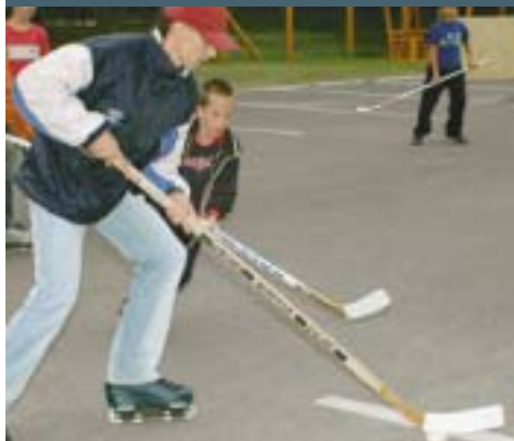
A görhoki először szerepelt a sportprogramban