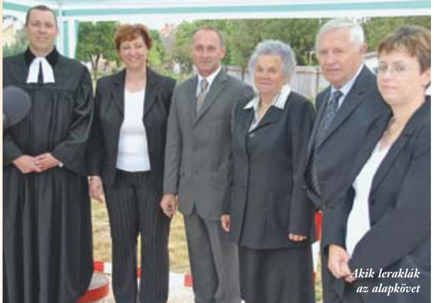
Akik leraklák az alapkövet