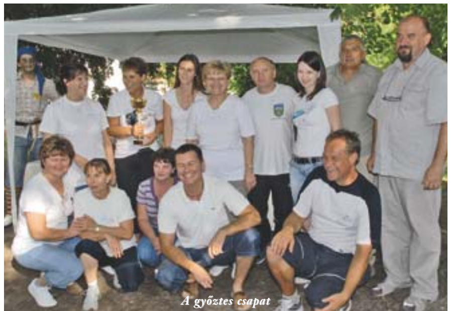
A győztes csapat