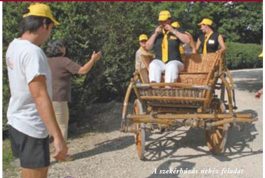
A szekérbúzás nebez feladat