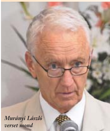
Murányi László verset mond

1884. június 25-én, azaz 125 éve született és 92 esztendeje hunyt el Gyóni (Áchim) Géza, az a költő, akinek versei milliókat lelkesítettek az első világháború idején.