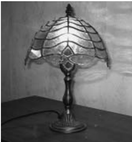
Legismertebbek a Tiffany lámpák

Az utóbbi néhány évben reneszánszát éli a díszüvegezés, ezen belül a Tiffany technika. Tulajdonképpen mi is ez? Minden szónál többet mond egy kép, tehát először is lássunk egy-két ilyen módszerrel készült tárgyat.