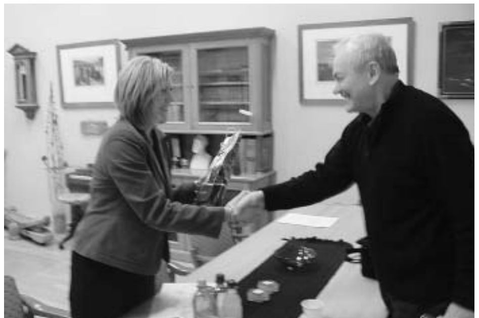
A két iskola igazgatója az együttműködési megállapodás aláírását követően

A felsőfokú szakképzést iskolánk szervezi, ezért diákjaink nincsenek hallgatói státusban, azonban ha mégis felsőoktatásnak minősül és a minimális gyakorla-