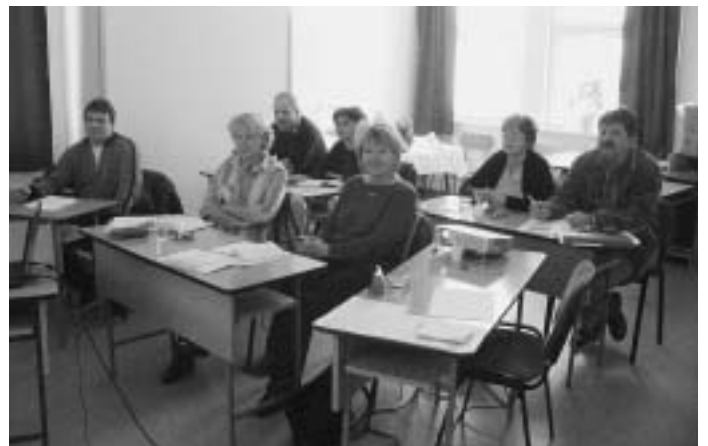
A résztvevők csoportbontásban az utolsó képzési napon